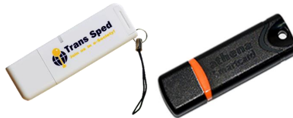
Athena IDProtect V3 + ASEDrive IIIe USB

Tipul de dispozitiv căruia i se adresează capitolul este: